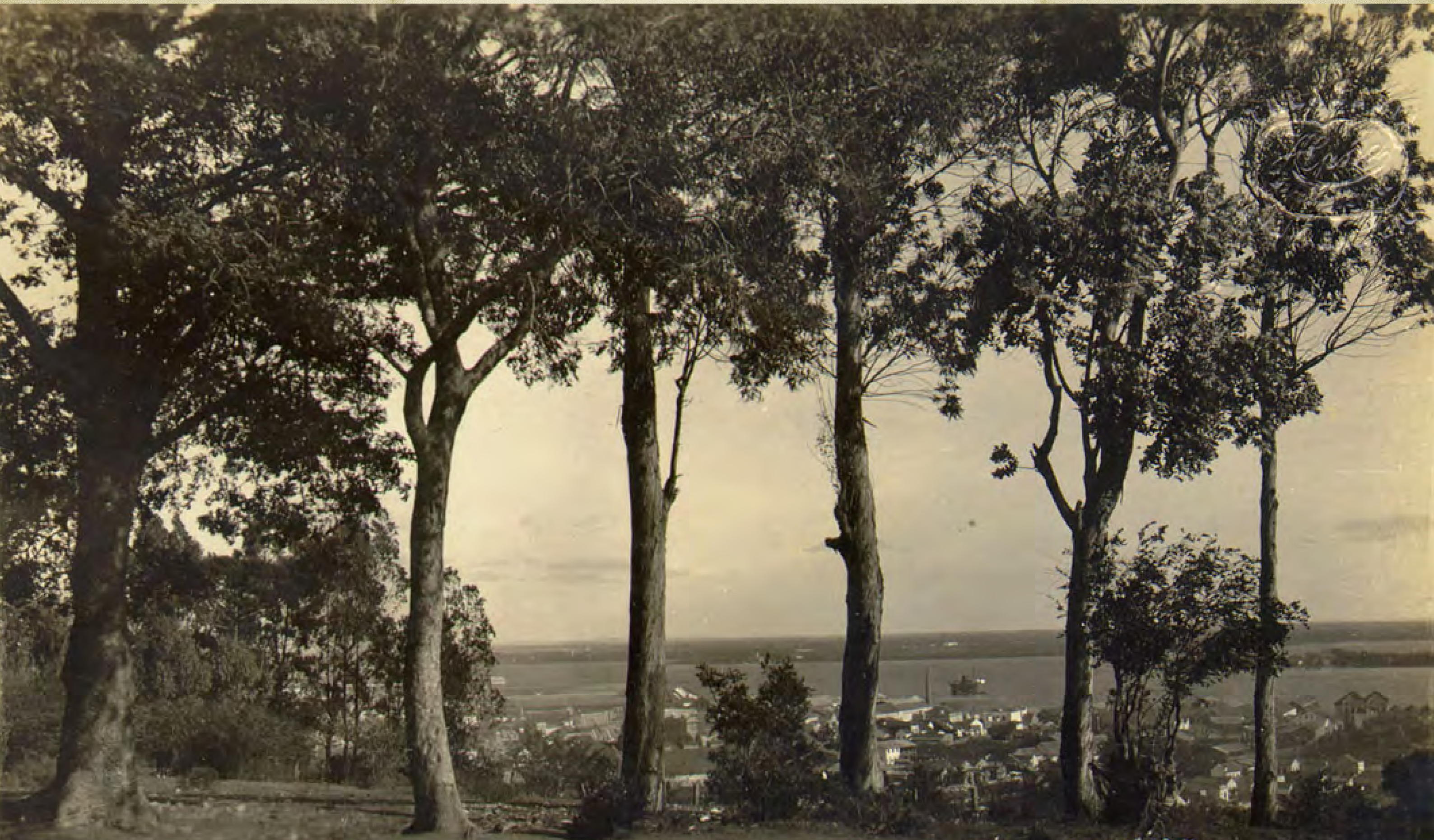
107. PORTO ALEGRE - PANORAMA - V. DA PATRIA - GUARIBA